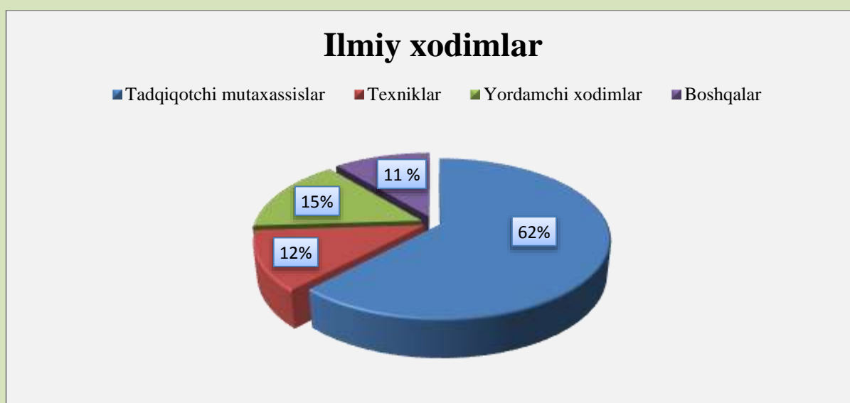
3-rasm: 2016 yilda ilmiy tadqiqot va tajriba-konstruktorlik ishlanmalarni bajargan ilmiy xodimlarning jamiga nisbatan ulushi, foizda

2016 yilda tadqiqotchi-mutaxassislarning 28,4 foizi (361 nafar) tabiiy fanlar sohasida, 24 foizi (300 nafar) gumanitar fanlar sohasida, 15 foizi (190 nafar) umumiy fanlar sohasida, qolgan 32,6 foizi (421 nafar) texnika, tibbiyot, qishloq xo'jaligi fanlari sohasida ilmiy tadqiqot ishlari olib borishgan.